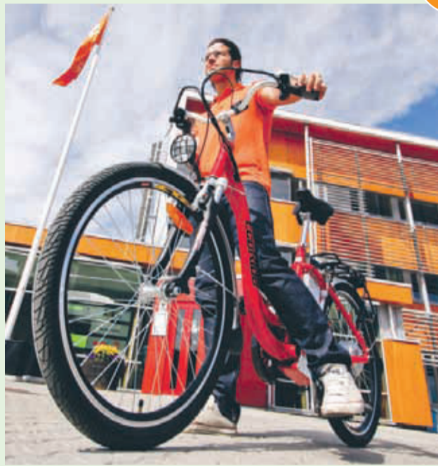
Ecoride Avenue Deluxe 26 är testpatrullens favorit. Elmotorn hjälper dig i uppförsbackarna, och priset är överkomligt.